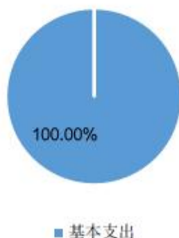
本年支出决算结构情况

本年支出合计 570.43 万元，其中：基本支出 570.43 万元，占 100%。