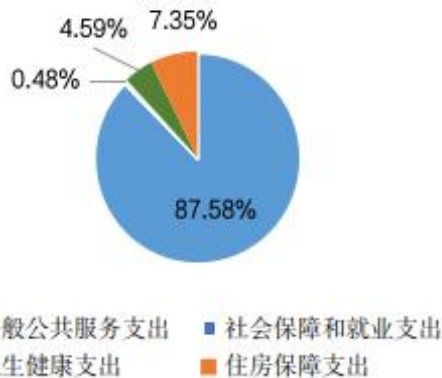
一般公共预算财政拨款支出决算结构

用于以下方面：一般公共服务（类）支出 45.18 万元，占 87.58%；社会保障和就业（类）支出 0.25 万元，占 0.48%；卫生健康（类）支出 2.37 万元，占 4.59%；住房保障（类）支出 3.79 万元，占 7.35%。